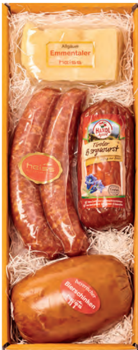
Art. Nr. 161 € 22,90 Bierschinkenkgugel ca. 430 g, Tiro- ler Bergwurst 250 g, Bauernmett- wurst 2 St. ca. 210 g, Allg. Emment- aler ca. 150 g. MH 4 Wo. bei kühler Lagerung