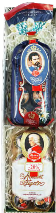
Art. Nr. 155 € 14,70 Reber Mozartkugeln 8 Stück, Reber König Ludwig Kugeln 8 Stück.