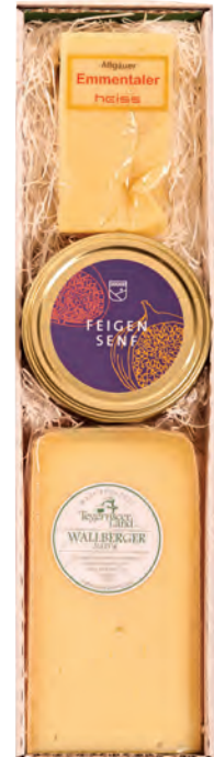
Art. Nr. 152 € 23,20 Allg. Emmentaler ca. 150 g, Wall- berger natur, Schnittkäse ca. 200 g, Feigensenf 200 g. MH 6 Wo. bei kühler Lagerung