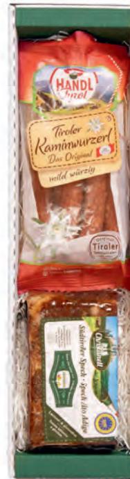
Art. Nr. 151 € 15,90 Original Südtiroler Speck 400 g, Tiroler Kaminwürstel 100 g. Die ideale Ergänzung zum Süd- tiroler Wein. MH 6 Wochen (auch ungekühlt)