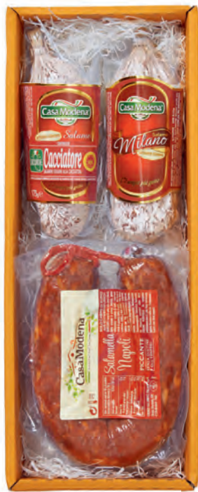
Art. Nr. 162 € 23,90 Salami Milano 200 g, Salami Cacci- atore 175 g, Salami Napoli Piccan- te ca. 400 g. MH 6 Wo. (auch ungekühlt)