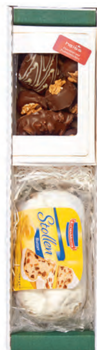
Art. Nr. 156 € 10,90 Florentiner & Pralinées 170 g, Butterstollen 200 g.