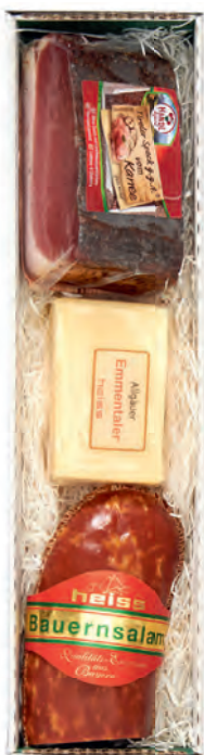
Art. Nr. 153 € 22,40 Original Tiroler Karreespeck 300 g, Bauernsalami Krakauer Art ca. 275 g, Allgäuer Emmentaler ca. 150 g. MH 6 Wo. bei kühler Lagerung