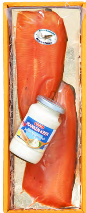
Art. Nr. 164 € 26,90 2 Stück Alpenland Lachsforellen- filet rohgeräuchert ca. 300 g, Sah- nemeerrettich 190 g. MH 16 Tage ab Versandtag, Versand erst ab 18.12.