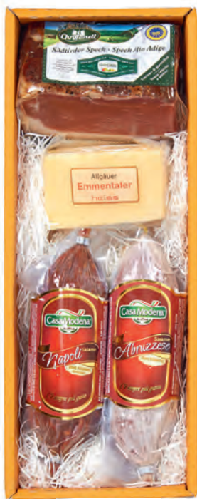
Art. Nr. 163 € 30,90 Orig. Südtiroler Speck 400 g, Allg. Emmentaler ca. 150 g, Salami Ab- bruzzese 200 g, Salami Napoli 200 g. MH 6 Wo. bei kühler Lagerung