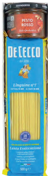
Art. Nr. 154 € 15,70 Pesto Rosso 180 g, Linguine „De Cecco“ 500 g.