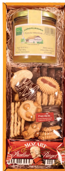
Art. Nr. 165 € 17,90 Bayer. Blütenhonig 500 g, Confi- serie-Weihnachtsgebäck 200 g, Reber Mozart Pralinériegel 45 g.