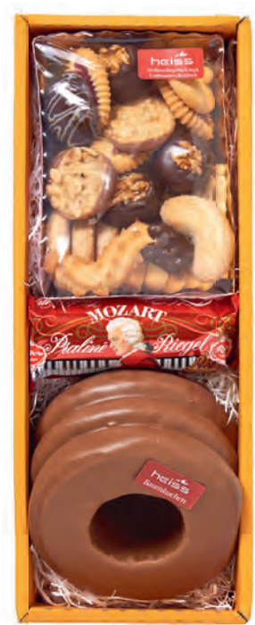
Art. Nr. 166 € 16,50 Baumkuchen Vollmilch 300 g, Con- fiserie-Weihnachtsgebäck 200 g, Mozart Praliné Riegel 45 g.