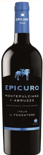
Montepulciano d'Abruzzo DOC

Rotwein trocken 13% vol. - Abruzzen Feinduftiges, aromatisches Bukett roter Früchte, würziger Charakter. Die 4-monatige Lagerung im Holzfass trägt zur Struktur und einer leichten Vanille-Note bei. Sehr weich und aromatisch.