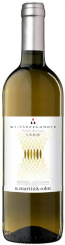
Weißburgunder DOC Lamm

Der Weißburgunder ist ein frisch-fruchtiger Weißwein, grünlich bis hellgelb, mit leichtem Apfelgeruch und trocken-fülligem Geschmack. Noten von Äpfeln, Birnen, grünem Laub und Zitrusfrüchten sind spürbar.