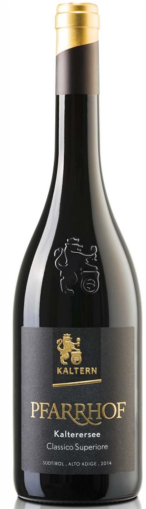
Kalterersee Auslese "Pfarrhof"

Dieser historische Weinhof liegt inmitten des Kalterer Weinanbaugebietes. Ertragsbeschränkung und sorgfältiger Ausbau in großen Eichenfässern machen ihn geschmeidig. Seine rubinrote Farbe, sein interessantes Bouquet nach Veilchen, gepaart mit rundem harmonischen Geschmack nach Bittermandeln, machen ihn zu einem außergewöhnlichen Vertreter seiner Art.