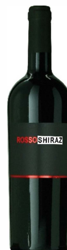
Rosso Shiraz Lazio IGT

100 % Syrah Aromen von Waldbeeren und Amarena- kirschen, harmonisch, ausgewogen.