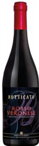
Rosso Veronese IGT

Der Botticato Rosso Veronese zeigt sich in dunklem Rubinrot und ein verführerischer Duft nach roten und schwarzen Kirschen kennzeichnen ihn. Er ist sehr aromatisch am Gaumen, dicht mit satter roter Fruchtintensität, warm, rund mit gut eingebundener Säure.