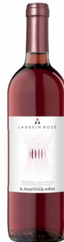
Lagrein Rosé DOC „Gries“

Der Lagrein Kretzer oder Rosé ist ein rosa- bis hellrubinroter Wein mit zartem und angenehmem Geruch. Er schmeckt anregend und frisch nach Veilchen, Kirschen und frischen Beeren. 100% Lagrein