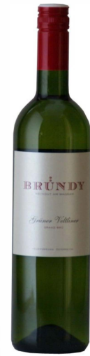
Grüner Veltliner Reserve 2015

Mittleres glänzendes Goldgelb. Intensives Bouquet voller Finesse mit Vanille und rauchigen Anklängen, Exotik mit Banane und Honigmelone. Am Gaumen kraftvoll mit Würze und feiner, harmonisch eingebundener Barriquenote, sehr lang ausklingend. Anspruchsvoll und lagerfähig. Selektion der besten Grüner Veltliner Trauben des Jahrgangs aus mehreren Rieden.