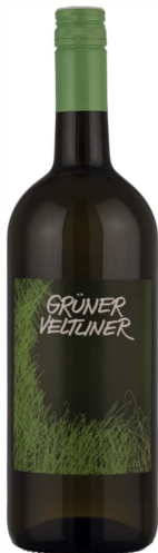
Grüner Veltliner QW

Kräuterige und vegetabile, auch etwas mineralische Kernobstnase. Recht würzig-kräuterig und zart bitterlich im Mund, hat gutes Rückgrat, eigenwillige, geradlinige Art, präzise, etwas zitronige Säure, ordentlicher bis guter Abgang.