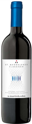
St. Magdalener Klassisch

Ein Wein von hellrubin- bis rubinroter Farbe. Er schmeckt angenehm mild und fruchtig, oft leicht nach Bittermandel, Veilchen und Kirschen.