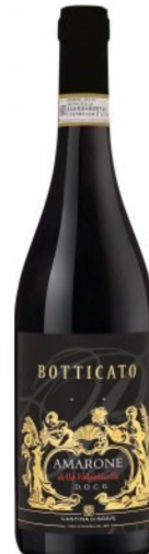
Amarone della Valpolicella DOCG

Intensive Fruchtaromen, seidig, samtige Tannine, schöne Länge. Die immense Konzentration des trockenen Rotweins wird dadurch erreicht, dass vollreife Trauben nach der Ernte auf Strohmatten ausgelegt und getrocknet werden. Durch die Konzentration von Zucker, Säuren und Aromen ein ganz besonderer Wein: Kraftvoll und alkoholreich mit überwältigenden Aromen dunkler Beeren, Rosinen, Pflaumen und Tabaknoten.