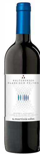
Kalterersee Klassisch "Feltner"

Der Vernatsch ist ein leichter, gerbstoffarmer Wein von hellrubin- bis rubinroter Farbe. Er schmeckt angenehm mild und fruchtig, oft leicht nach Bittermandel, Veilchen und Kirschen.