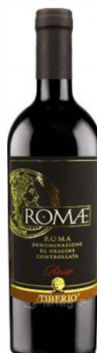
Romae Rosso DOC

Konzentrierte Frucht, saftig, viel Charakter, vollmundig, geschmeidig, warm. Die traditionellen Rotweinsorten Italiens, Montepulciano und Sangiovese, verleihen dem Rotwein seinen angenehm warmen, fruchtintensiven Charakter.