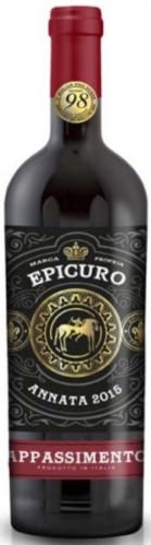
Appassimento Rosso epicuro