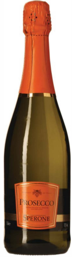
Prosecco Spumante Brut

Wahrscheinlich ist Prosecco „Sperone“ der beste aller bekannten trockensten italienischen Schaumweine. Seine goldgelbe Farbe und der anhaltende Duft machen diesen Wein weich und harmonisch. Er kann die ganze Mahlzeit begleiten, ist aber auch als Aperitif sehr gut.