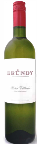
Roter Veltliner Rosenberg

Leicht nussiger, vegetabiler und erdiger Duft mit Kernobstaromen, etwas Melone und einem Hauch Pfeffer sowie mineralischen Anklängen. Geradlinige, recht würzige Frucht im Mund, vegetabile und erdige Anklänge, zart süßlicher Schmelz und feine Säure, recht gute Nachhaltigkeit am Gaumen, leichter Gerbstoff, süßlich und herb zugleich im ordentlichen Abgang.