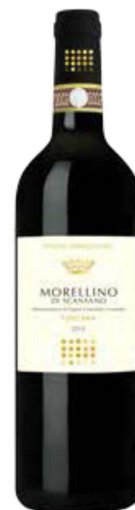
Morellino di Scansano DOCG

Aromen vollreifer Amarena Kirschen, viel Würze, warmherzige, kräftige Statur, Tiefe und Eleganz. Morellino di Scansano stammt aus dem Ort Scansano im Südwesten der Toscana. Wie die übrigen noblen Weine der Toscana wird Morellino di Scansano aus Sangiovese Trauben gekeltert, die regional als "Morellino" Traube bezeichnet wird.