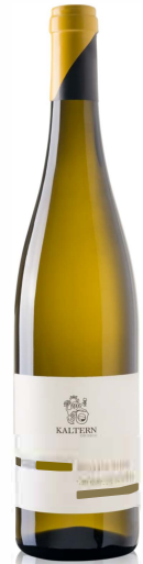
Goldmuskateller DOC, lieblich

Der Goldmuskateller ist ein feiner, aromatischer Dessertwein mit gelb- bis goldgelber Farbe, angenehm nach Muskat duftendem Geruch und ausgeprägt süßem Geschmack. Reminiszenzen an Zitrusfrüchten und Bratäpfel sind häufig.