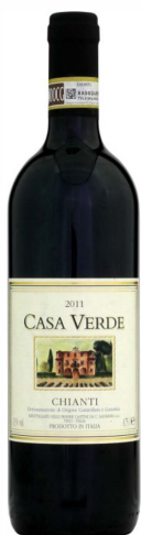
Chianti DOCG „Casa Verde“

Der angenehm blumige, fein strukturierte, rubinrote Chianti aus der Toskana mit orangefarbenen Reflexen wird von einem Brombeer- und Himbeerbouquet geprägt. Eine frische, aromatische Säure und reife Tannine verleihen diesem trockenen Rotwein zusätzlichen Charakter. Dieser Chianti besticht mit seiner fruchtigen, gefälligen Art.