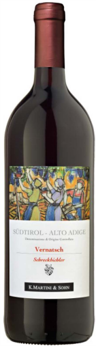
Südt. Vernatsch „Schreckbichl“ DOC

Bei uns in Bayern erfreuen sich die 1 L-Abfüllungen nach wie vor großer Beliebtheit als Zechwein. Der Wein ist angenehm im Gaumen, ohne Schwere und besticht durch die typische zarte Vernatschfrucht. Der Vernatsch ist ein leichter, gerbstoffarmer Wein von hellrubin- bis rubinroter Farbe. Er schmeckt angenehm mild und fruchtig, oft leicht nach Bittermandel, Veilchen und Kirschen.