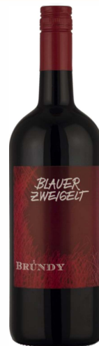
Blauer Zweigelt QW

Klares Rubinrot mit leicht violetten Rändern. Ein besonders fruchtiges Bouquet nach Kirsche und schwarzer Ribisel. Am Gaumen entfalten sich genau diese Fruchtaromen, und gemeinsam mit einer gut eingebundenen Säure und feinen Tanninen sorgt dieser Zweigelt für viel Trinkvergnügen.