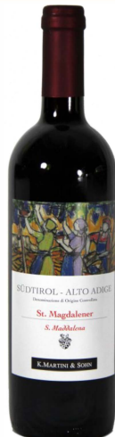
St. Magdalener DOC

Der St. Magdalener ist ein leichter, fruchtiger und charakteristisch-stilvoller Rotwein, der im Anbaugebiet St. Magdalena in Südtirol aus den Spielarten der Vernatschtraube gewonnen wird. Die Geschichte dieses Weines ist mehr als ein Jahrhundert dokumentiert und dürfte bis ins Mittelalter zurückreichen.