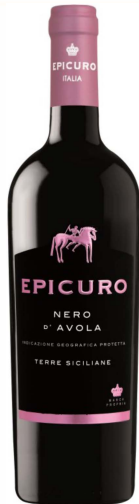
Nero d'Avola epicuro IGP

Rotwein trocken 12,5% vol. - Sizilien Intensive Aromapalette von Pflaumen über Schwarzkirschen bis hin zu einer feinen Kräuterwürze. Verführerisch im Duft, warm und mit belebender Frucht.