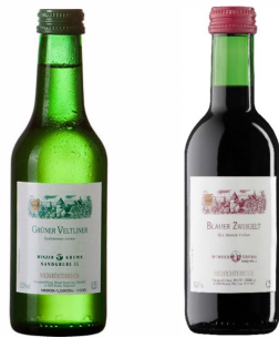
Grüner Veltliner + Blauer Zweigelt

Großer Wein in kleiner Flasche. Beschreibung siehe Grüner Veltliner und Blauer Zweigelt „13“. Die „Stifterl“ sind zu 12 Fl. abgepackt.