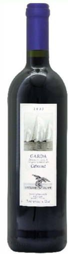
Garda Cabernet DOC

Cabernet Sauvignon - 11,5 % Vol. Würzige Frucht, Substanz und kraft