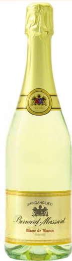
Blanc de Blancs Extra Dry

Dieser Jahrgangssekt wurde mit einer Dosage von 19 g/L Restzucker versetzt. Der Begriff "Blanc de Blancs" bedeutet das die hochwertigen Grundweine ausschließlich aus weißen Trauben bestanden. Der Sekt ist frisch, spritzig, zeigt feine Fruchtnoten, ist elegant und besitzt viel Charme.