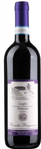
Nebbiolo Langhe DOC

Jugendliches Fruchtaroma, duftig, kraftvoll