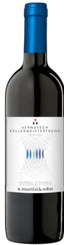
Vernatsch Kellermeistertrunk DOC

Der Vernatsch ist ein leichter, gerbstoffarmer Wein von hellrubin- bis rubinroter Farbe. Er schmeckt angenehm mild und fruchtig, oft leicht nach Bittermandel, Veilchen und Kirschen.