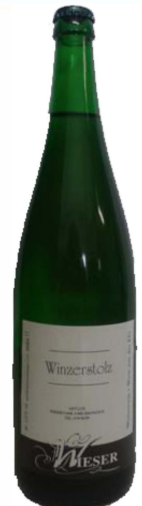
Winzerstolz weiß Landwein

Ein trocken ausgebauter Weißwein mit Trauben aus Slowenien und der Steiermark. Ideal als Spritzer, eine preiswerte Alternative zu rein österreichischen Weinen. Im 12er Mehrwegkasten.