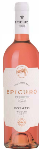
Rosato epicuro IGT

Rosé trocken 13% vol. - Apulien Die Rebsorten Primitivo und Negroamaro verleihen dem Rosato seine elegante Korallenfarbe. Intensives Bouquet feiner Obst- und Beerennoten. Am Gaumen vollmundig und ausgewogen mit fruchtigen Himbeer- und Erdbeernoten.