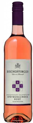
Spätburgunder Rosé halbtrocken

Sehr fruchtig, apart und duftig im Bukett. Ein charaktvoller, klarer Burgundertyp. In der Farbe helles Gelb mit grünen Reflexen.