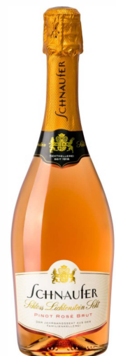
Jahrgangssekt Pinot Rosé

12 % Vol. Rosé-gekelterte Burgunderweine eines Jahrgangs und die schonende zweite Gärung mit langem Reifelager auf der Feinhefe ergeben diesen frischen Rosé-Sekt. Die feine Perlage, ein fruchtiger Duft, der körperreiche, frische Geschmack und seine Mineralität zeichnen diesen Rosé-Jahrgangssekt aus.