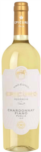
Chardonnay / Fiano epicuro IGT

Weißwein trocken 13% vol. - Apulien Im Geschmack überwiegen reife, gelbe Früchte, viel Schmelz und eine dezente aber animierende Säurestruktur.