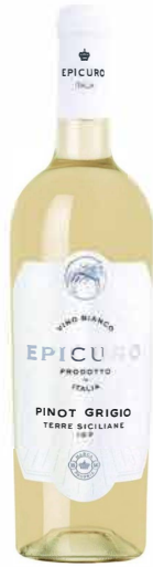
Pinot Grigio IGP

Der Epicuro Pinot Grigio wurde aus sizilianischen Trauben erzeugt und auf der Feinhefe ausgebaut. Er zeigt eine sehr schöne Nase mit Aromen von Honigmelone, Birne, etwas Banane, Grapefruit, Mandeln, Heu, ein Hauch von Brioche und Akazienblüten. Am Gaumen frisch, zarte Säure, füllig, feinfruchtig, fressenreich, elegant, zarter Schmelz, feine Spiel und ein langer Nachhall.