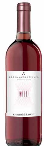
Rosenmuskateller IGT, lieblich

Der Rosenmuskateller ist sizilianischen Ursprungs und ein feiner, aromatischer roter Dessertwein mit hellrubinroter Farbe und intensivem Rosenduft. Sein Aroma ist vollmundig, süß und würzig.