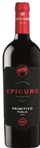
Primitivo epicuro IGP

Rotwein trocken 13% vol. - Apulien Dunkles Purpurrot, Aromen von Pflaumen und Süßkirschen. Feine würzige Noten, körperreiche Frucht. Warm am Gaumen, reifen Tanninen, langer Abgang.